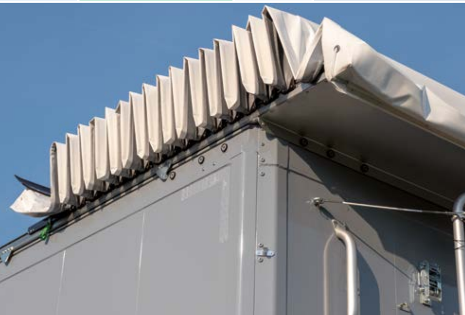
Schwimmend gelagert und robust Floating and sturdy