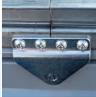
Schienenteilung Rail division